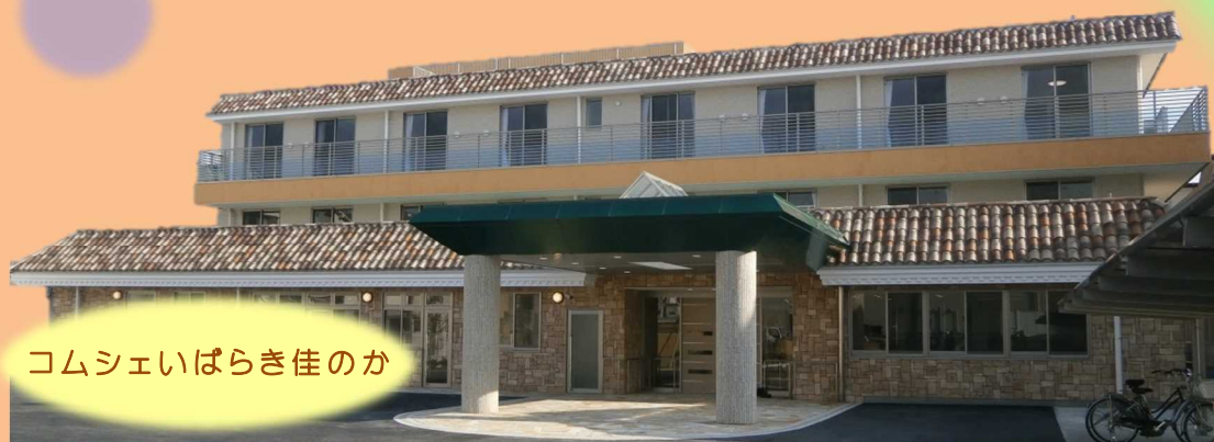
コムシェいばらき佳のか