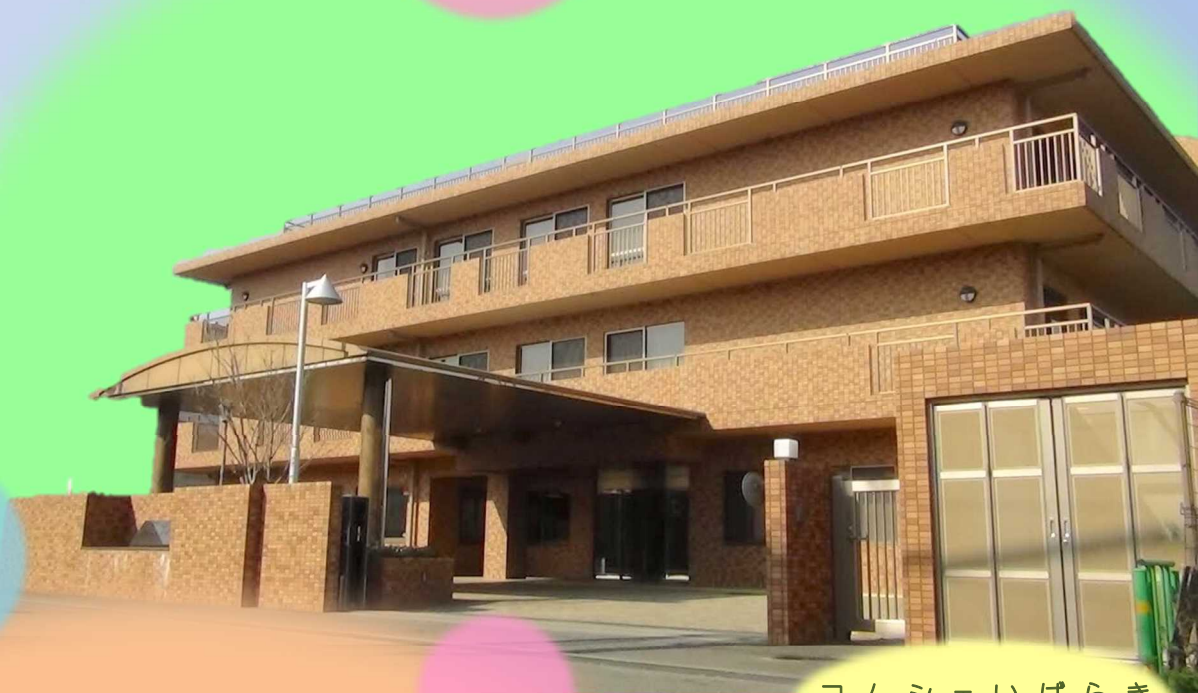
コムシェいばらき