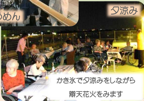
かき氷で夕涼みをしながら 辯天花火をみます