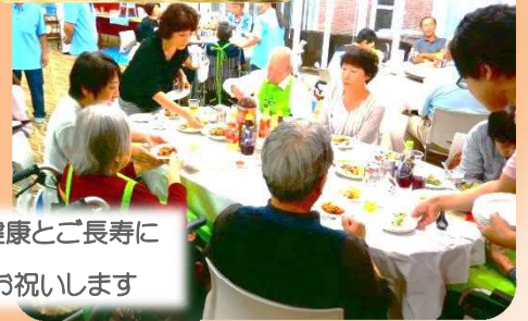
皆さんの健康とご長寿に 感謝し、お祝います