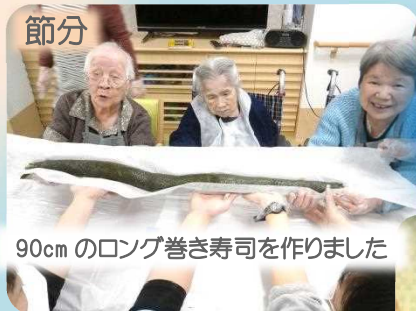
90cmのロング巻き寿司を作りました