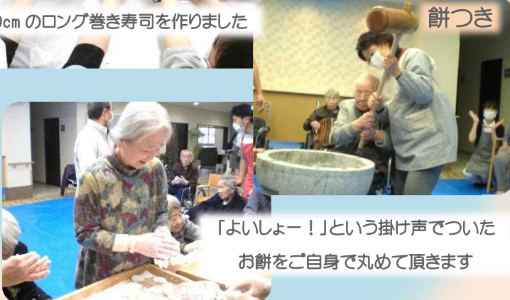
「よいしょー！」という掛け声でついた お餅をご自身で丸めて頂きます

他にも、新年会、おやつや食事作り、 クリスマスバイキングに年忘れ会など、 ここに載りきれないイベントが 盛りだくさんです！ 日常生活だけでなく、イベントを通じて 皆様の自立を支援・援助させていただきます。