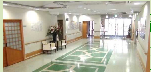
◀ 玄関・エントランス

皆様をお迎えする空気のあたたかさ と上質な空間に包まれる心地よさ。 それこそ私たちが目指すライフステージです。